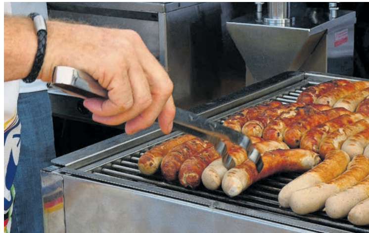
Les manifestations soumises à autorisation exigent un contrôle du grill à gaz qui doit être effectué par un contrôleur agréé externe.

Si l'organisateur d'une manifestation exige une preuve qu'un grill à gaz est sûr, le contrôle de celui-ci ne peut être effectué que par une personne dûment qualifiée. Vous