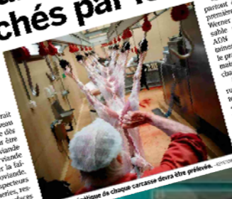
Une trace génétique de chaque carcasse devra être prélevée.

Un prélèvement ADN devrait être effectué sur chaque bœuf ou bovin abattu en Suisse dès le printemps 2018. «Pour être sûr que la viande est bien suisse», il y a bien de la viande suisse», a indiqué hier la tête de la branche Proviande. Par la suite, des inspecteurs vont dans les boucheries, restaurants ou grandes surfaces en prenant des échantillons de produits carnes pour voir si le